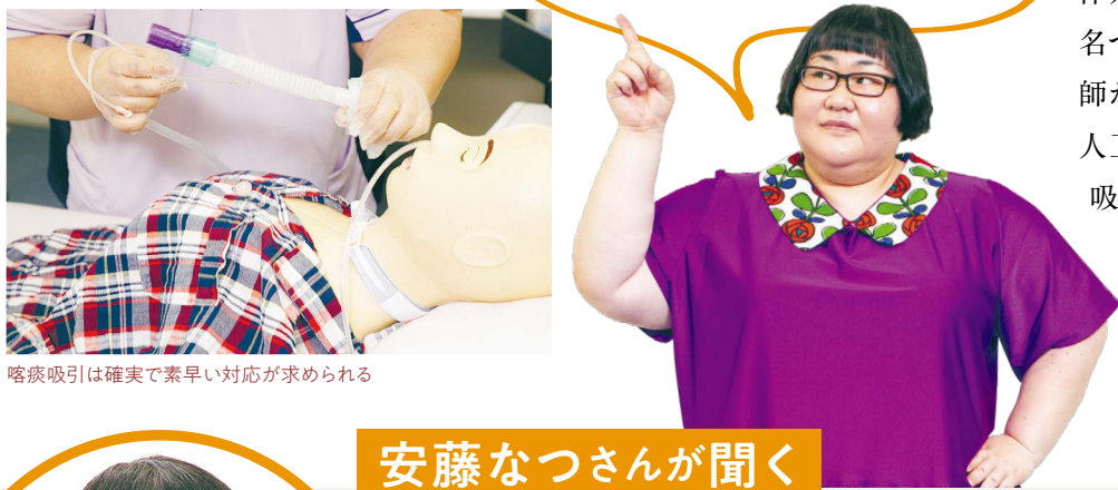
喀痰吸引は確実に素早い対応が求められる